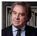
› Wilmotte & Industries