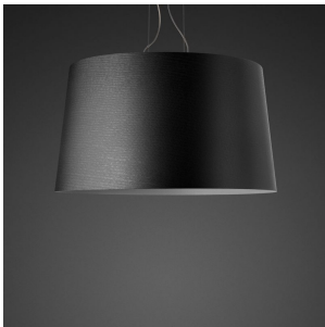
Twice as Twiggy