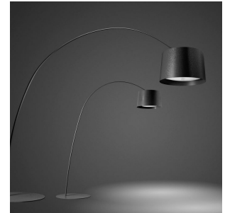
Twice as Twiggy